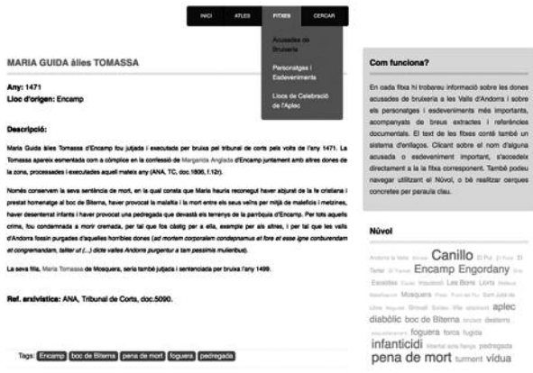
Fig. 2. Captura de pantalla d'una fitxa individual de la base de dades http://terradebruixes.cultura.ad/ind-ex.php/fitxes/acusades-de-bruixeria

acusades (p. ex., Canillo, Encamp i Engordany), els càrrecs i sentències més habituals (infanticidi, pena de mort) o l'elevat nombre de vídues entre les dones acusades (#vídua). Finalment, la plataforma permet també efectuar cerques amb text lliure, i ofereix així la possibilitat a l'usuari de navegar pel contingut de la base de dades a la recerca d'aquells elements que consideri interessants i que no apareguin recollits en el sistema d'etiquetatge.